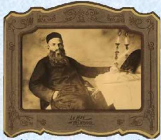
ערב שבת קודש