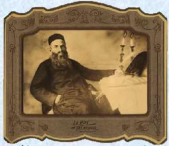
ערב שבת קודש